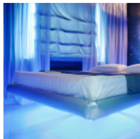
Бизнес-план отеля на час