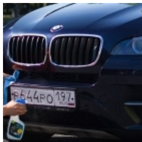
Бизнес-план мобильной автомойки